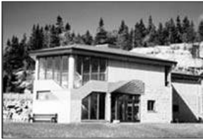
Maison du Granit 301, route du Morne Lac-Drolet (Qc) G0Y 1C0 Tél. : (819) 549-2566