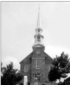
Église Saint-Sébastien-de-Frontenac 280, rue de la Fabrique Saint-Sébastien (Qc) G0Y 1M0 Line: 819-652-1078