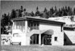
Maison du Granit 301, route du Morne Lac-Drolet (Qc) G0Y 1C0 Tél. : (819) 549-2566