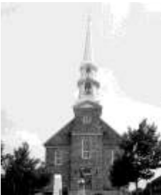
Église Saint-Sébastien 280, rue de la Fabrique St-Sébastien-de-Frontenac (Qc) G0Y 1M0 Line: 819-652-1078